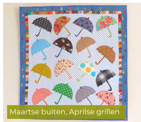
Maartse buiten, Aprilse grillen