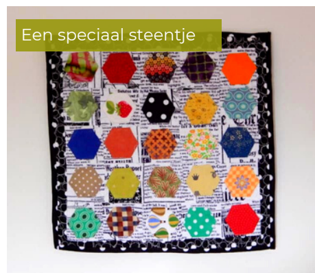
Een speciaal steentje