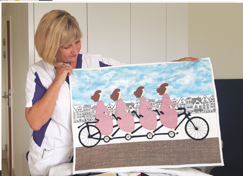
Fietsen in Kopenhagen